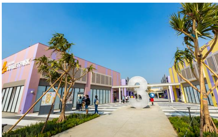
「MITSUI OUTLET PARK 台中港」第 1 期 外觀