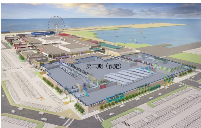
「MITSUI OUTLET PARK 台中港」全區示意圖