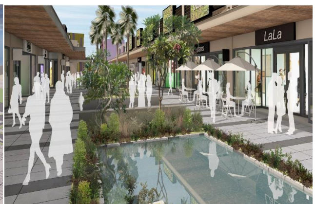
「MITSUI OUTLET PARK 台中港」二期館內示意圖