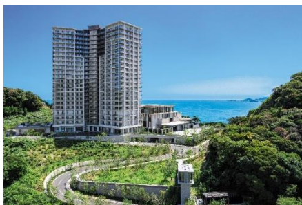
パークウェルステイト鴨川