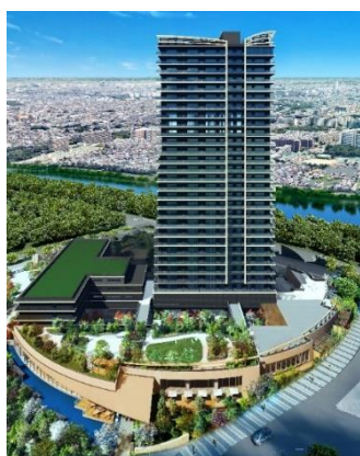
(仮称)パークウェルステイト幕張計画