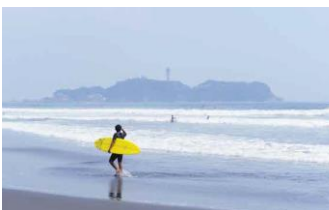
人気の海水浴スポット