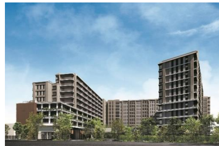
パークウェルステイト千里中央