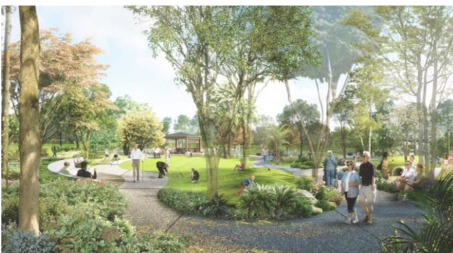
広場完成予想イメージ