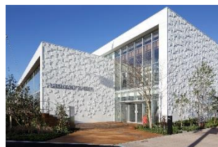
湘南ならではのライフスタイルを提案する文化複合施設 (Fujisawa SST 内に立地)