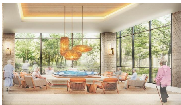
ラウンジ完成予想イメージ