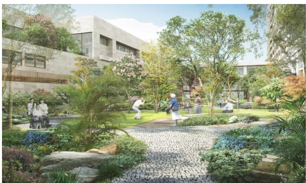
(仮称)プライベートガーデン完成予想イメージ

入居者が楽しめる約 1,100 m 2 の(仮称)プライベートガーデンや地域に開かれた広場など、敷地内に緑豊かな植栽を計画することで、多彩な植物と四季の移ろいを楽しむことができます。