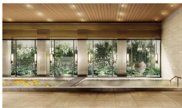
大浴場完成予想イメージ