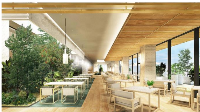
ダイニング完成予想イメージ

※ 4 湘南の生活を愉しめる入居者専用のサロン。コンシェルジュによる湘南のアクティビティ・サービスを提供。