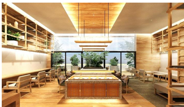
ライブラリー完成予想イメージ