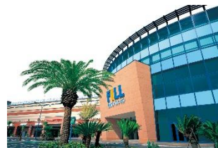
日々の生活に便利なスーパーや大型ホームセンターが揃う