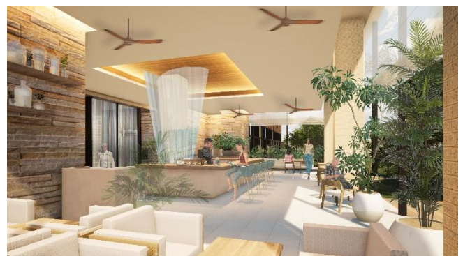
カフェ完成予想イメージ