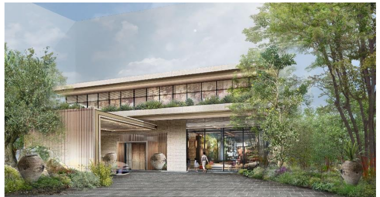
共用棟完成予想イメージ