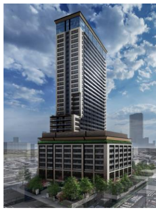
(仮称)パークウェルステイト西麻布計画