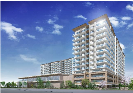
全体外観完成予想イメージ