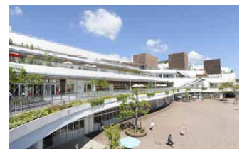
「好感度ファッション」の店やシネマが揃う