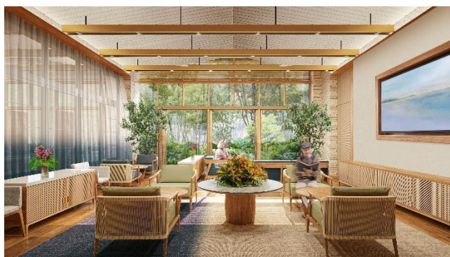
(仮称)湘南サロン完成予想イメージ