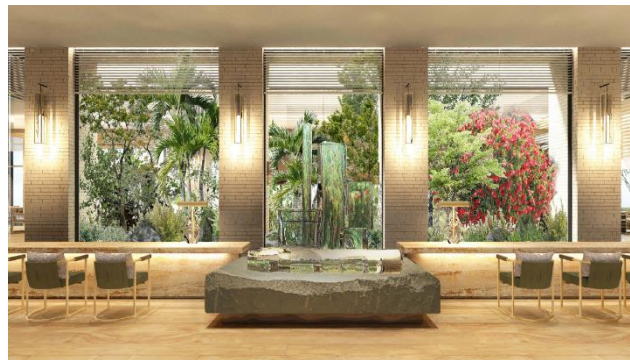
ダイニング完成予想イメージ