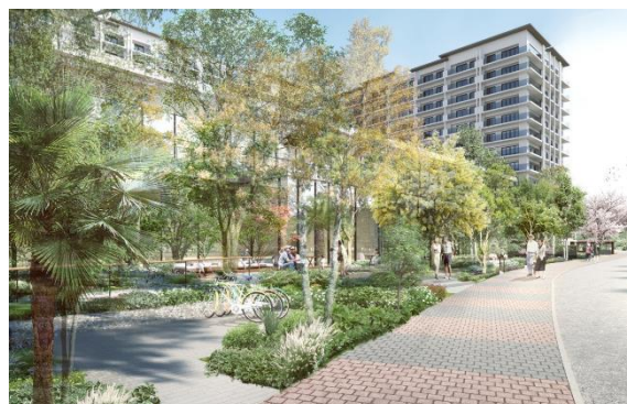
敷地南側完成予想イメージ