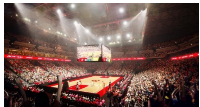
（仮称）LaLa arena TOKYO-BAY