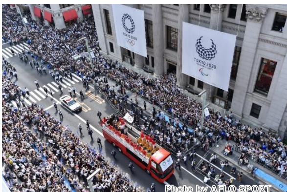
リオ2016大会日本代表選手団 メダリストパレード

当社は、2015年4月に不動産開発における東京2020オリンピック・パラリンピック競技大会（以下、東京2020大会）のゴールド街づくりパートナーに就任し、パートナー企業の皆様と共に大会を支えてまいりました。東京2020大会および北京2022オリンピック・パラリンピック冬季競技大会において人々に夢と感動を与え、人々の絆を繋いでくれた日本代表選手団「TEAM JAPAN」に共感し、パリ2024オリンピック・パラリンピック競技大会に向けて挑戦する「TEAM JAPAN」を引き続き街づくりで応援していきます。三井不動産グループのステートメントである「都市に豊かさや潤いを」を目指し、街づくりとスポーツ支援活動の共創を通して、東京2020大会のレガシーの一つである「スポーツの力」を活用した街づくりに取り組んでまいります。