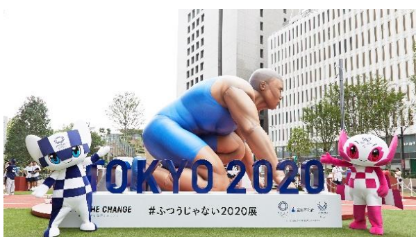
ふつうじゃない2020展