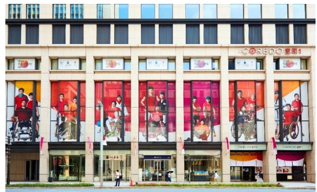
日本橋シティドレッシング for TEAM PARALYMPIC