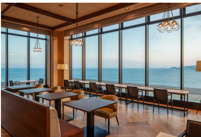
オーシャンビューダイニング

本物件には、オーシャンビューダイニング(コンパスグループ・ジャパン株式会社に業務委託)、オーシャンビュープール、ジャグジー、天然温泉の運び湯を使用した大浴場・露天風呂、約 1,500 冊の書籍を持つライブラリー、ホール、アトリエ、ビリヤード、麻雀ルーム、ピアノルーム、クラブラウンジ&バー、などの娯楽施設や、憩いの場となる Kasane ガーデンなど、ご入居者のコミュニティを育む共用空間と様々なプログラムやイベントを提供します。またご入居者の各居室にはタブレットが設置されており、共用施設の予約や、ダイニング・大浴場の混雑状況の情報を見る事ができる等、ご入居者の生活を IT 技術でサポートいたします。