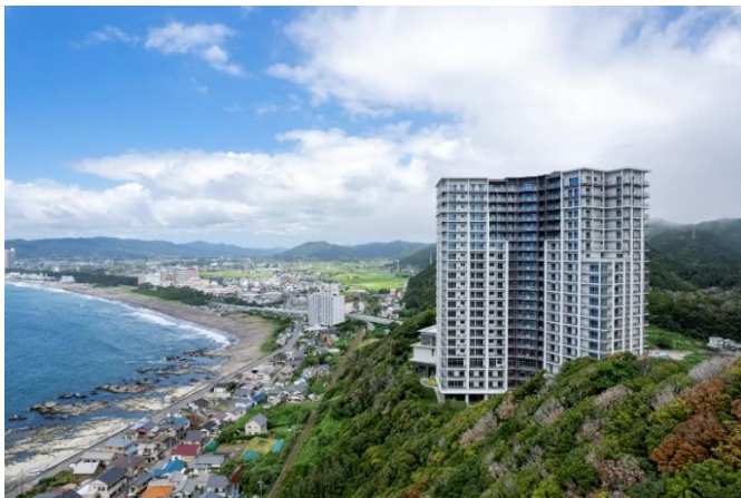
「パークウェルステイト鴨川」外観

本物件は、太平洋を望む標高約 46m の高台に建つ 22 階建のトリスター形状の建物です。約 2/3 の住戸からは、太平洋の大海原や日本の渚百選に選ばれている前原・横渚海岸の海岸線の眺望を愉しむことができ、また約 1/3 の住戸からは山々の美しい緑の眺望を満喫いただけます。さらに、ダイニング、大浴場、最上階のラウンジからも、海や山々のダイナミックな眺望をご覧いただくことができます。建物の足元には約 2,200 ㎡もの広大な中庭に、日本の棚田百選に選ばれている大山千枚田(鴨川市)をイメージした Kasane (かさね) ガーデンを設け、豊富な緑と趣向を凝らした水景がご入居者の憩いの空間を創出します。