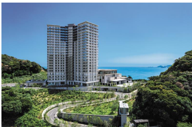
「パークウェルステイト鴨川」外観

ブランドコンセプト「Life-styling × 経年優化」のもと、多様化するライフスタイルに応える商品・サービスを提供するとともに、安全・安心で快適にくらせる街づくりを推進し、持続可能な社会の実現・SDGsへ貢献してまいります。