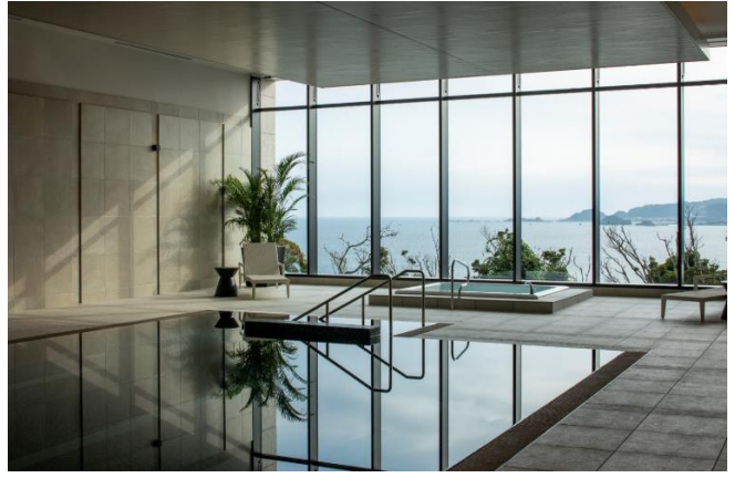
オーシャンビュープール