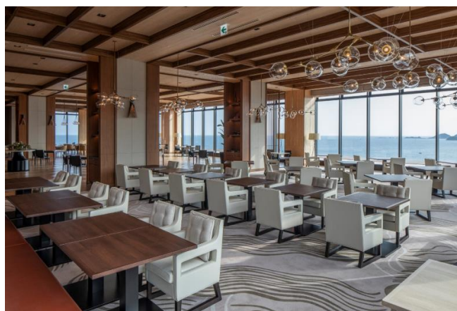
オーシャンビューダイニング