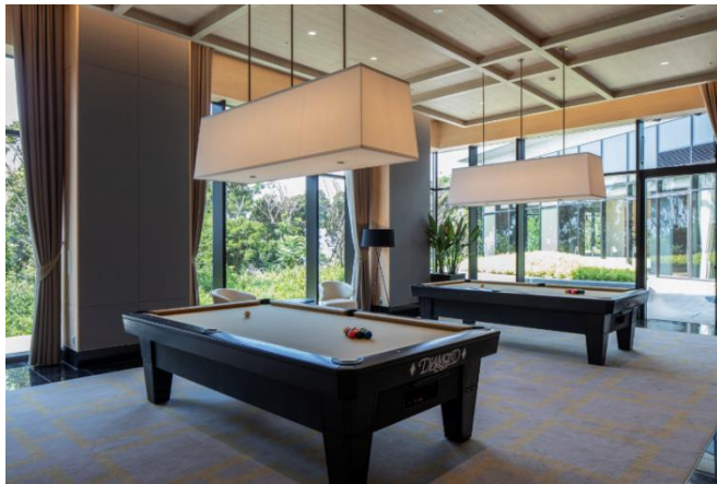
ビリヤードルーム