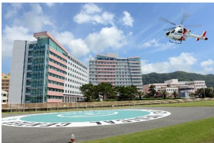
亀田メディカルセンター (※3)