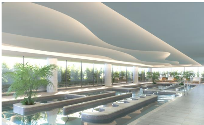
ウェルネスプール完成予想イメージ

当フロアは、株式会社ウェルネスデベロップメントに設計監修から運営まで委託しており、プールやフィットネスルームでの運動プログラムの提供なども予定しております。同社は、医学的・科学的に検証された自然療法のメソッドを活用した施設・サービス・商品開発を全国で展開しており、本物件でもそのノウハウを活用し、日々ご利用いただくことで健康維持につながるサービスを提供いたします。