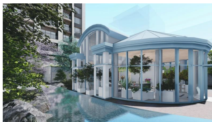
ティーパビリオン完成予想イメージ