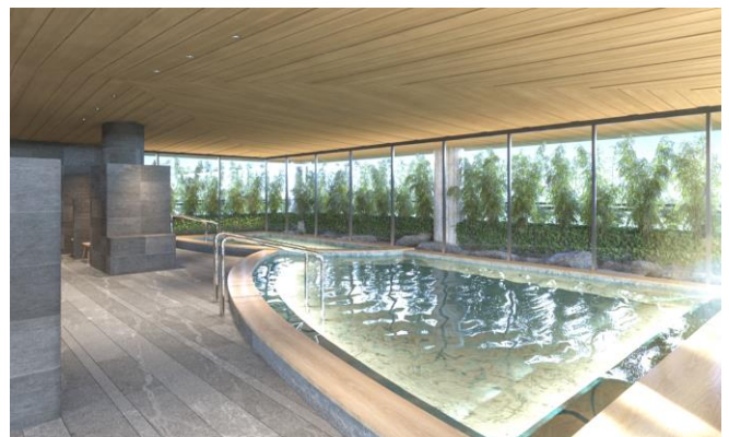
大浴場完成予想イメージ