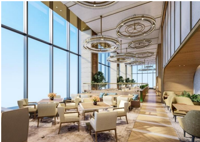
ダイニング完成予想イメージ

ダイニングでは栄養計算された日替わりのセットメニューやアラカルトメニューを、プライベートガーデンに囲まれた離れ空間である「ティーパビリオン」では、ブッフェ形式のコンチネンタルブレックファストや喫茶などを提供いたします。