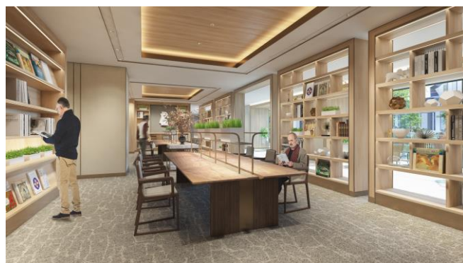
ライブラリー完成予想イメージ