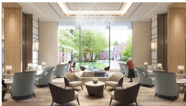
ロビーラウンジ完成予想イメージ

共用空間には、ラグジュアリーホテルのようなロビーラウンジやライブラリーなどを配し、ご入居様が心地よく過ごせるような空間として設けております。また、居室空間は、当社マンション事業のノウハウを生かしたデザインとクオリティに加え、車いすの回転スペースの確保や、生活リズムセンサーやカードキーによる在不在管理など、シニアのための機能性も備えております。