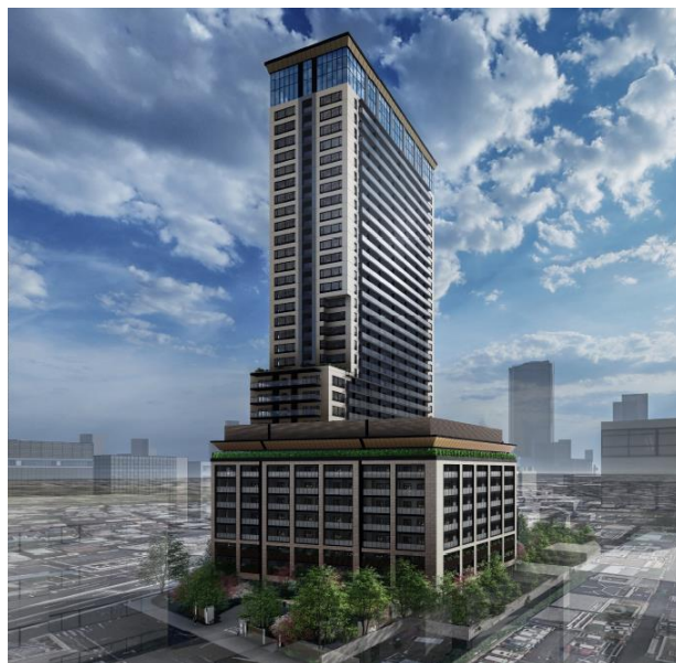
建物全体完成予想イメージ