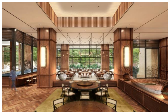
メインダイニング完成予想イメージ