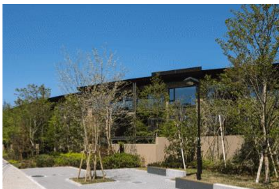
パークウェルステイト浜田山