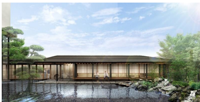
離れ完成予想イメージ

※イベント等については、今後の新型コロナウイルス感染症の状況を注視し、管轄行政機関との協議・指導の下、安全の確保を前提として適切な開催内容・方法を検討してまいります。