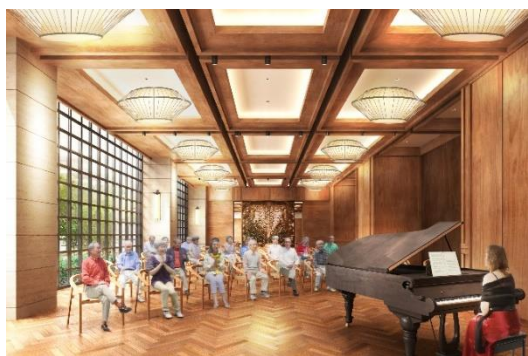
多目的ホール完成予想イメージ