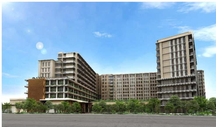
「(仮称)パークウェルステイト豊中計画」完成予想イメージ

なお、本計画は、2019年6月開業の「パークウェルステイト浜田山」、2021年11月開業予定の「パークウェルステイト鴨川」に続く第3号物件で、関西圏では初の展開となります。