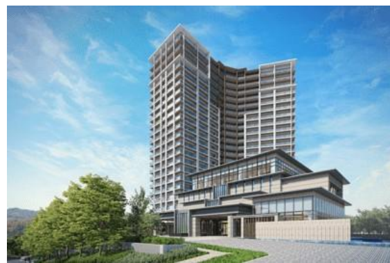
パークウェルステイト鴨川