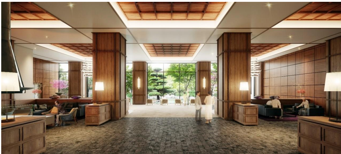
エントランスホール完成予想イメージ

また、全548戸という規模感を生かしたエントランスホールなど、建物の顔となる部分は広い空間と高い天井高に贅沢な設えを施したラグジュアリーな空間としています。