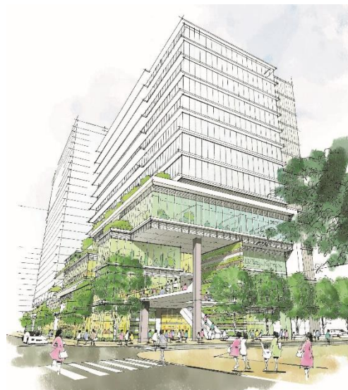
【1階中野駅前広場側商業イメージ】

駅から連なるペDESTリアンデッキを敷地内に延長し、デッキレベルの歩行者ネットワークを創出します。