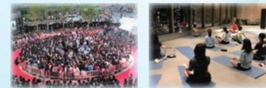
街の賑わいの創出