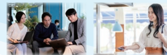
法人向け多拠点型シェアオフィス