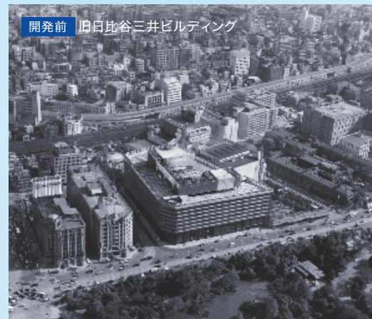
開発前 旧日比谷三井ビルディング

強固な財務基盤 (2020年度末) D/Eレシオ 1.42 借入長期比率(ハンricosを除く) 95.5% コミットメントライン未使用枠 4,000億円