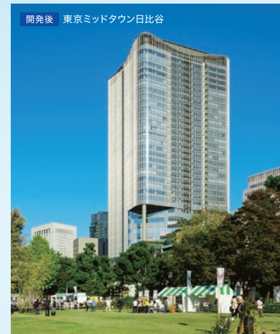
開発後 東京ミッドタウン日比谷