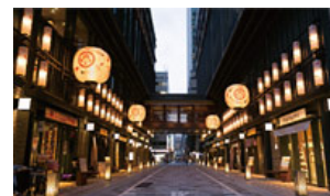
江戸時代の涼の取り方を現代風にアレンジしたイベント「ECO EDO 日本橋」