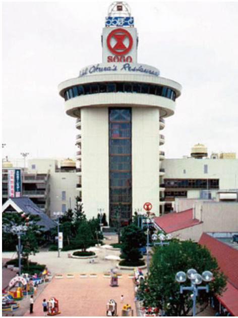
オープン当時の「ららぽーとTOKYO-BAY」（千葉県船橋市）