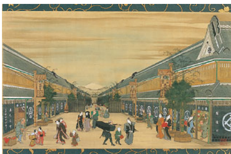
江戸時代の日本橋「越後屋」