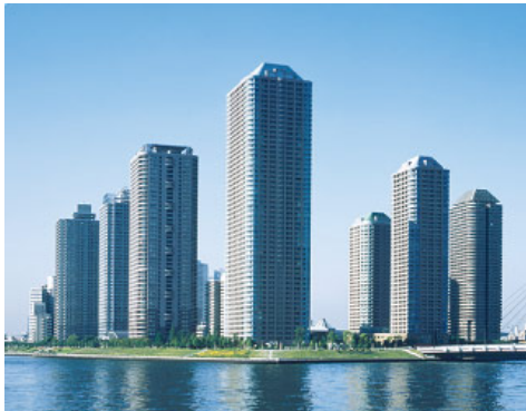
「大川端リバーシティ21」（東京都中央区）