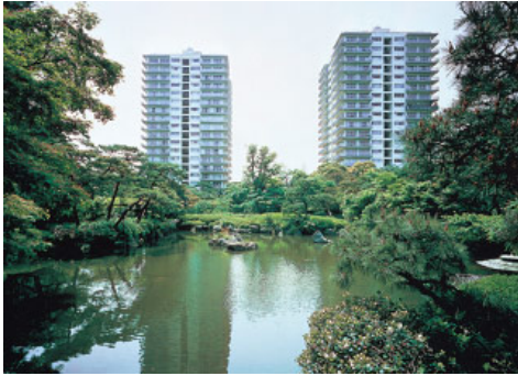
「三田綱町パークマンション」（東京都港区）