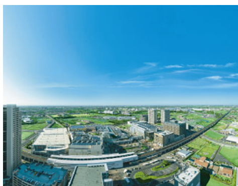
「柏の葉スマートシティ」(千葉県柏市)