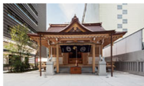
千年以上の歴史を持つ「福德神社」の社殿再建に協力

歴史に学び、先人の知恵を借りることで、失われた街の機能や人々のにぎわいなどを蘇らせる取り組みを行っています。