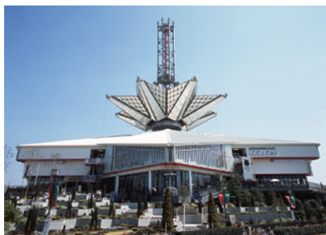
「三井アウトレットパーク大阪鶴見」(大阪市鶴見区)