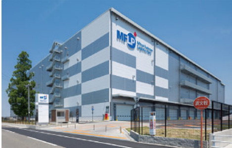
MFLP稲沢（愛知県稲沢市）※2017年竣工