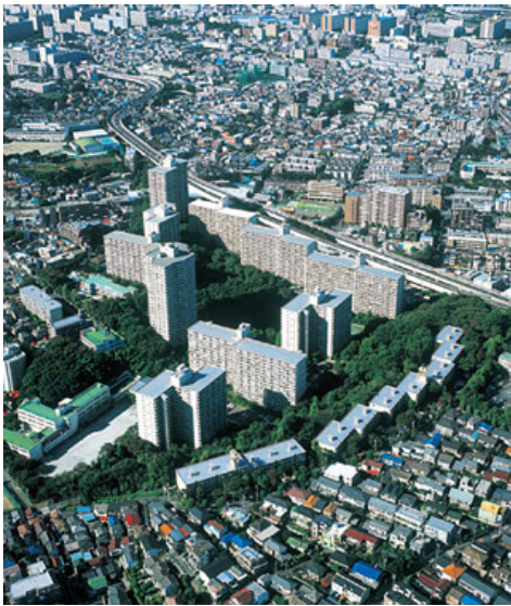
森に囲まれた現在の「サンシティ」（東京都板橋区）