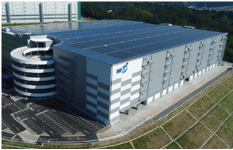
MFLP茨木（大阪府茨木市）※2017年竣工