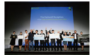
国際ビジネスコンテストも開催