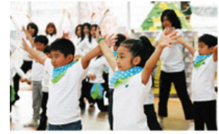
独自の健康増進プログラムも提供