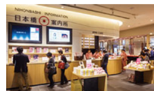
外国人コンシェルジュも常駐する「日本橋案内所」