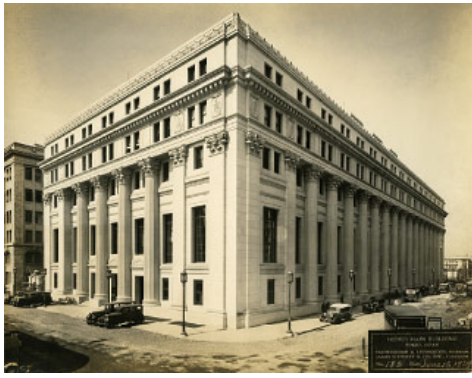
竣工当時の「三井本館」(東京都中央区)