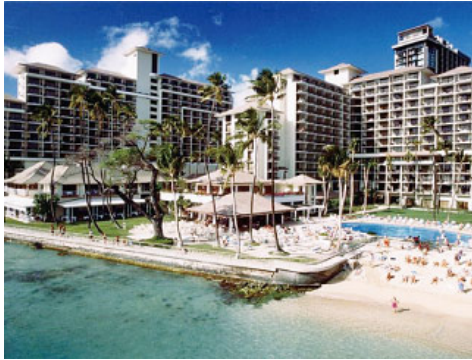
現在の「ハレクラニ」（ハワイ・オアフ島）