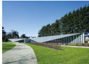
先進的なデザインを発信する「21_21 DESIGN SIGHT」