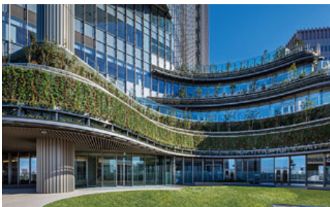
都市と公園が融合したランドスケープ