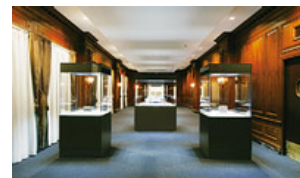
多数の美術品を収蔵する「三井記念美術館」