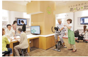
健康づくり拠点まちの健康研究所「あ・し・た」

自治体と連携した健康事業、実証実験のモデルタウンなどの取り組みを通じて、超高齢化社会に対応した街、子どもからお年寄りまで誰もが健康やかに暮らせる街をめざしています。