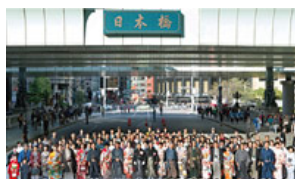
街を活性化するさまざまなイベントを実施

歴史や文化を大切にしながら、未来を見据え、時代が求める「価値創造」を行っていく。日本橋再生から日本再生をめざします。