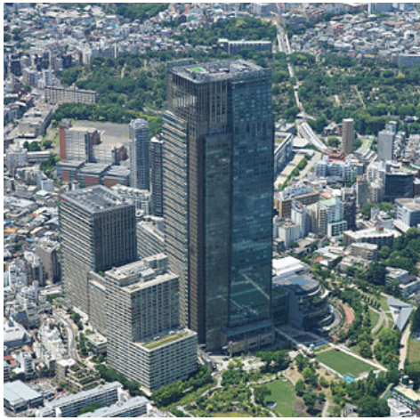
「東京ミッドタウン」 (東京都港区)