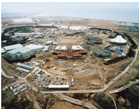
開発中の東京ディズニーランド