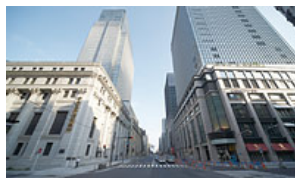
重要文化財でもある「三井本館」との調和を図った景観づくり

伝統文化や歴史的建造物、地域コミュニティなどと共生・共存し、未来へ残すことが、私たちの使命だと考えています。