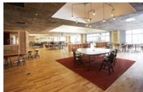
イノベーションを生み出す拠点「KOIL」 (柏の葉オープンイノベーションラボ)

新ビジネスや起業家を支援するインキュベーション施設をはじめ、大学・研究機関など知の拠点が集積。日本に新しい活力をもたらす新産業の芽を育て、サポートしています。