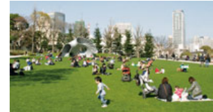
開発面積の約40%が緑あふれるオープンスペース