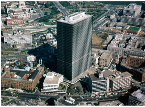
竣工当時の「霞が関ビルディング」（東京都千代田区）