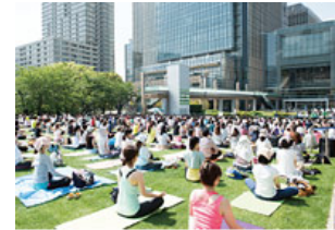
広大な緑の上で催されるさまざまなイベント