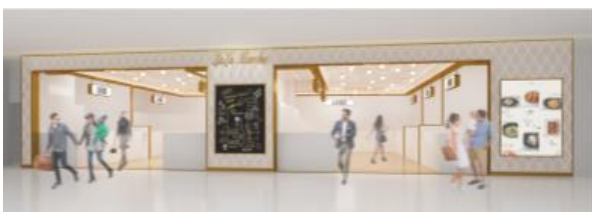
LaLa Marche CG

轻饮食·食品零售区真实还原日本地下百货的区域，其中设置了包括日本和中国的甜点店、咖啡厅等店铺。